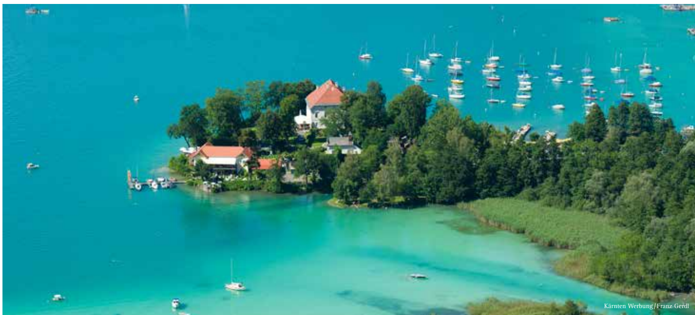
Kärnten Werbung/Franz Gerdl